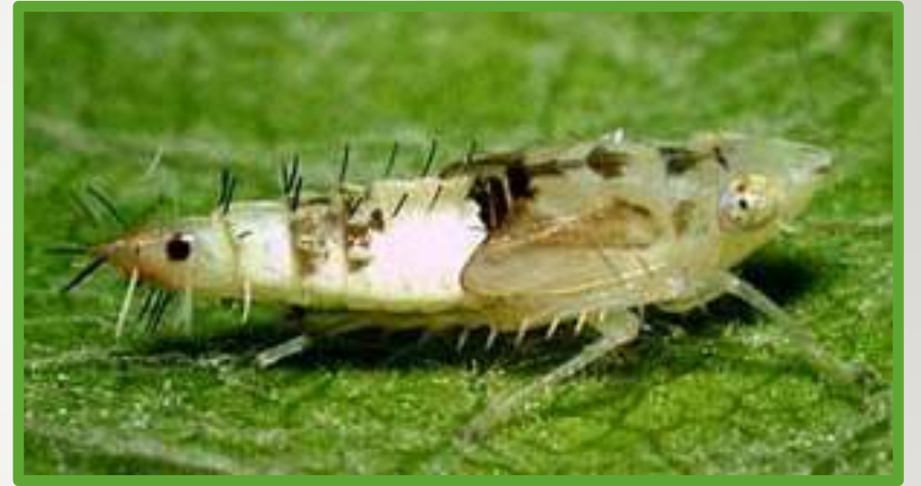
Личинка старшего возраста