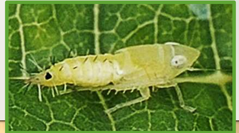
Личинка младшего возраста