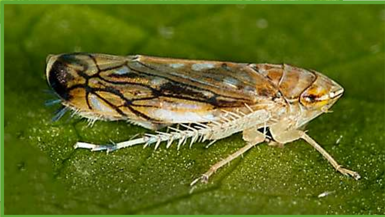
Взрослая особь (имаго)